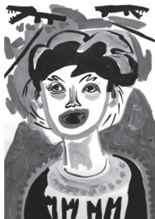
buzzhead 42 x 59 cm Acryl auf Papier, 2008

April bis 1. Mai zu den Geschäftszeiten des KVE geöffnet: Di/Mi/Fr 15-18 Uhr, Do 15-19 Uhr sowie Sa 11-14 Uhr.