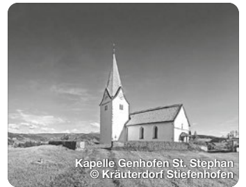
Kapelle Genhofen St. Stephan