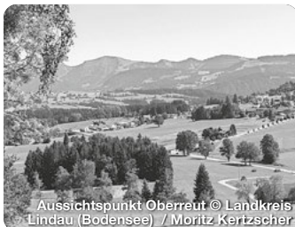
Aussichtspunkt Oberreit