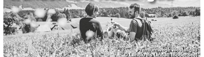
Premiumwege Westallgäu

Das Westallgäu ist eine wunderschöne Voralpenlandschaft, die zum Wandern und Erkunden einlädt. Die Region bietet auf ihren zertifizierten aussichtsreich Premiumwanderwegen über 65 Wanderkilometer, die vorbei an rauschenden Gewässern, zu weiten Ausichten und durch die Kühle des Waldes führen. Hinter jeder Kurve der Wander- und Spazierwege entdeckt man ein neues Naturerlebnis. Eine Besonderheit, die auch das Deutsche Wanderinstitut davon überzeugt hat, die sieben Wandertouren für ihre hohe Erlebnisqualität auszuzeichnen. Jeder der 3 Pruzume-Wanderwege und 4 Premium-Spazierwanderwege im Westallgäu hat