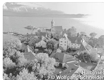
Halbinsel © Wolfgang Schneider